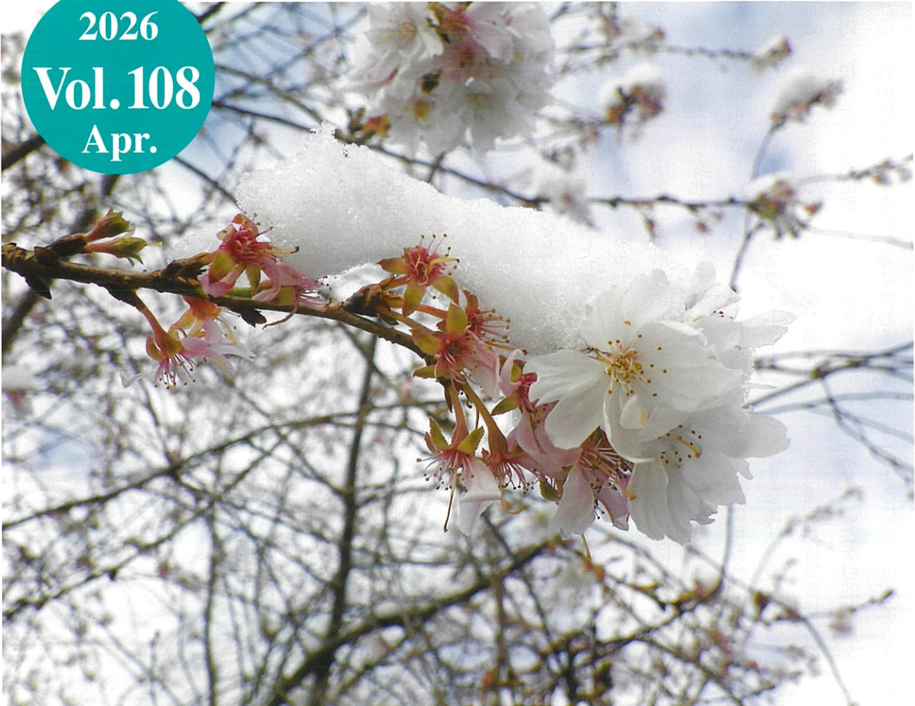
令和7年度林業・環境緑化写真コンクール応募作品 タイトル：「雪と十月桜」