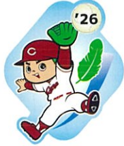
アタッチメント：蝶ピン サイズ：W20×H25mm 素材：ステンレス