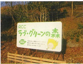
RCC ラブ・グリーン of the Forest