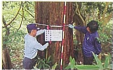
メタセコイヤ (スギ科メタセコイヤ属) 所在：作木町伊賀和志 樹の大きさ： 胸高幹周 3.41m (県内第1位の大きさか?)