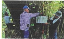
カツラ (カツラ科カツラ属) 所在：作木町光守 樹の大きさ： 胸高幹周 10.34m (県内第1位の大きさ)