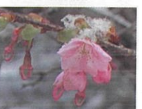
雪をかぶった河津桜