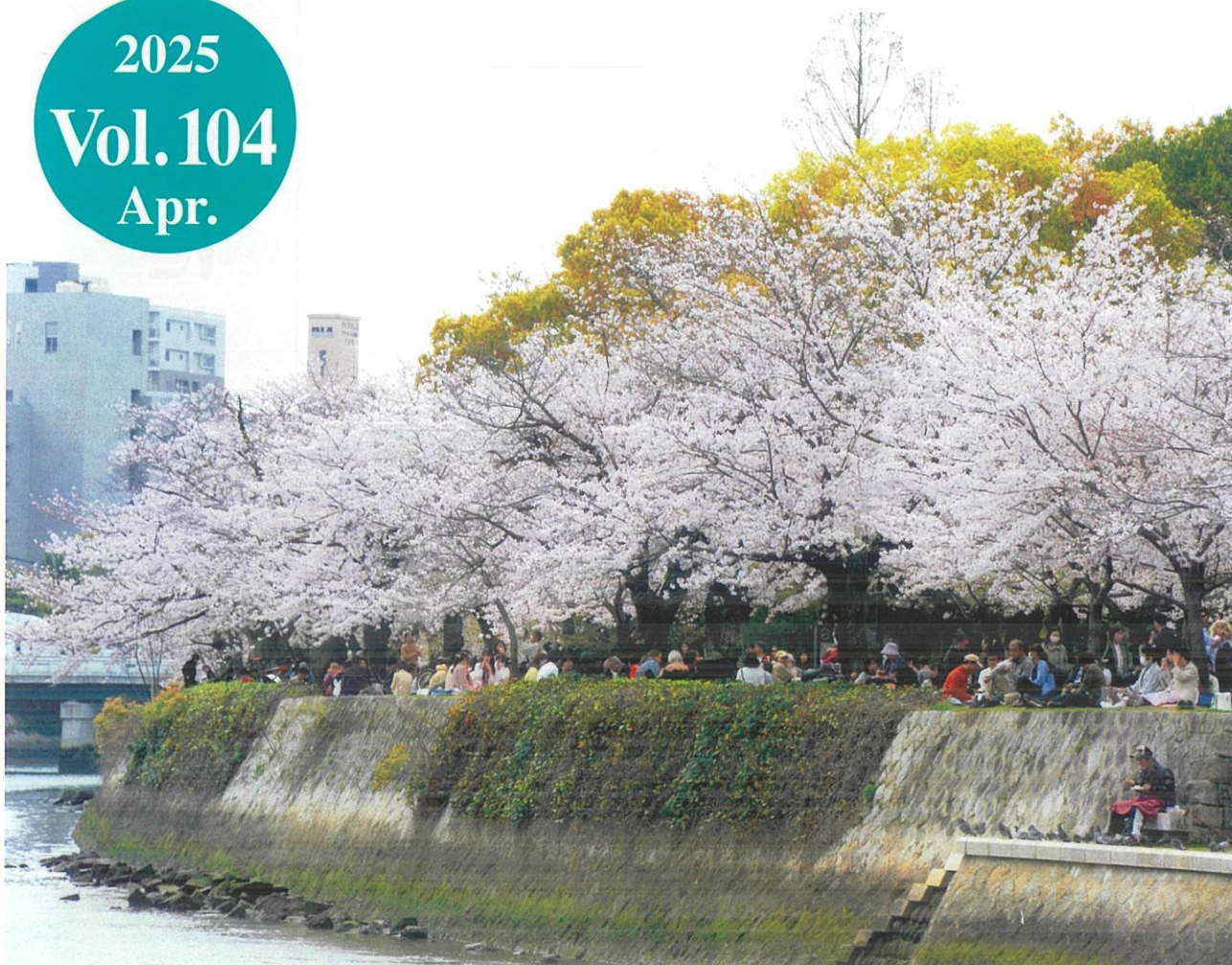
令和6年度林業・環境緑化写真コンクール応募作品 タイトル：「河川堤防の桜並木と民衆」