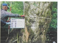
アカイタヤ (カエデ科カエデ属) 所在：作木町岡三測 樹の大きさ： 胸高幹周 4.50m (県内第1位の大きさ)