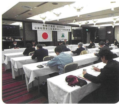
令和7年度定時総会の様子

最初に、第一号議案の「議事録署名人の選任」を行い、次に、第二号議案の「令和6年度貸借対照表、損益計