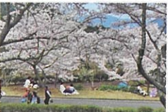
さくら通りでお花見

「緑化センターは広すぎて分からないよ。」という方のために手軽に探せる「桜マップ」やより詳しい「さくら位置図」も用意していますし、ホームページからもご覧いただけます。