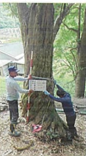
イヌマキ (マキ科マキ属) 所在：作木町伊賀和志 樹の大きさ：胸高幹周 2.71m (県内第2位の大きさ)