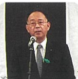
沖井県議会副議長祝辞

算書及び財産目録」についての説明と、これに関連する「令和6年度事業報告」があり、原案のとおり承認されました。 続いて、第三号議案の「役員を選任」を行い、役員選任の承認されました。 以上により、令和7年度定時総会を終了しました。