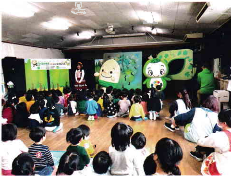
どんぐりくん、ふあみたと学ぶ森の役割