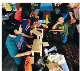
▲ 木工体験 各家族は、ミニチュアの椅子と貯金箱をつくった。