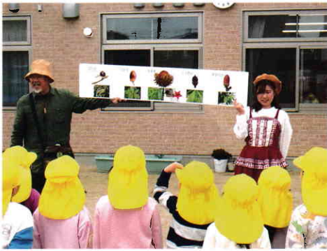
どんぐりのお勉強