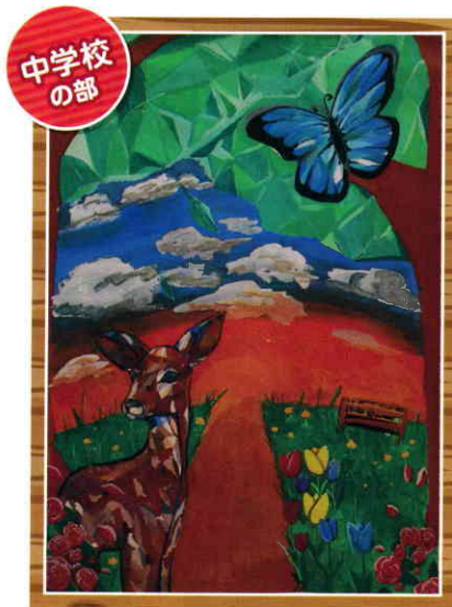
広島市立五月が丘中学校1年