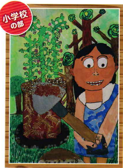
福山市立久松台小学校4年