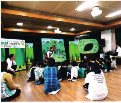
森のお姉さんとの楽しいおしゃべり

今年11月に、広島県では3回目となる「森の教室」が、国土緑化推進機構と広島県みどり推進機構の主催により、株式会社ファミリーマートの「夢の懸け橋募金」による特別協力、東広島市の協力を得て、東広島市の3箇所の保育所において開催されました。