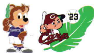
「サンフレッチェ」・「カーブ」 コラポピンバッジ

から、ロゴやペットマークの無償使用について協力して頂き、コラボした募金資材を製作することができました。