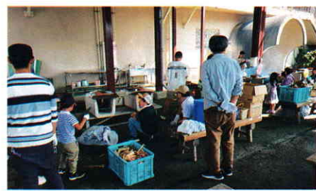
▲ 羽釜でご飯炊き 木の葉から割りばし薪割りの杉の木を利用してご飯炊き