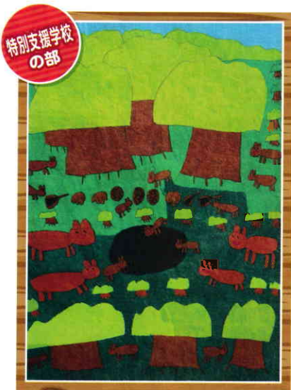
広島県立廿日市特別支援学校高等学校部3年