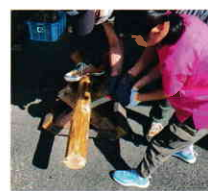
▲ 初めての丸太切り

▼ 丸太切り体験、薪割り体験、羽釜体験、木工体験は、家族で募集し自分で丸太切り、薪割りをし、木の葉で火付け割った木でご飯を炊く体験をした。工作はやはり楽しいのだ。参加者28名。