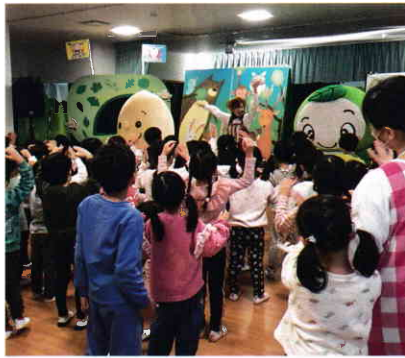
皆で踊る森のダンス