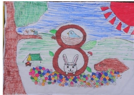
皆でアイデアを出し合い、短時間で見事な仕上がり。 キャンプファイヤーや翌日の朝の集い時に旗を披露し、旗にこめた思いを発表しました。