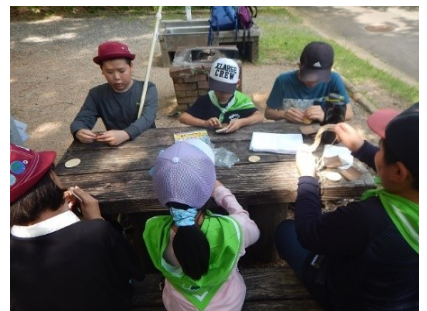
輪切りにしてあるリョウブの木に丁寧に紙やすりをかけ名前を入れて、オリジナルの名札が完成。