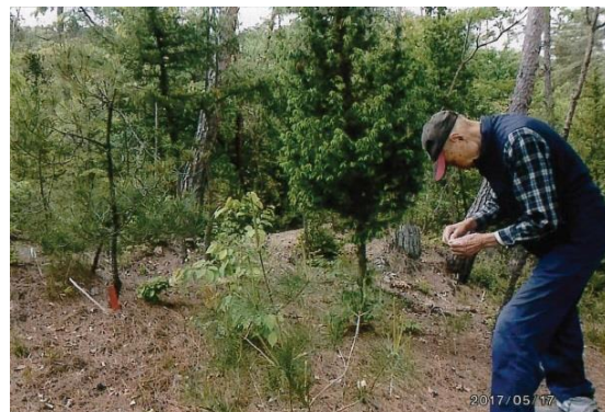
95歳の現在もマツタケ山再生に取り組む