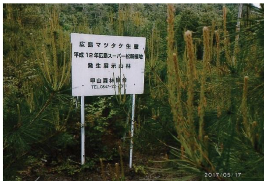
長年にわたりマツタケ発生環境を調査研究